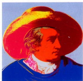
Farbe – Goethes naturwissenschaftliche Passion

Aufgrund dieser Beobachtung polemisierte Goethe gegen Newtons Theorie, wonach Weiß alle Regenbogenfarben – Rot, Grün, Blau nebst Zwischenstufen – enthalte. Denn nach der gleichen Logik könne man auch behaupten, die Finsternis (das Schwarz) umfasse